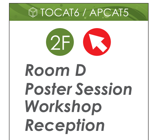
← 設置場所確定後シール貼り ×3枚