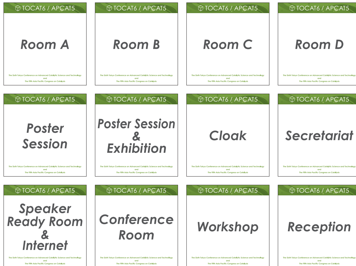
■コーナーサイン W450×H450 1:30